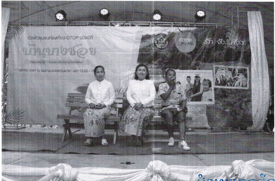
ฐานข้อมูลกลุ่มอาชีพ หมู่ที่ ๗ บ้านบางซอย ตำบลคุระ อำเภอคุระบุรี จังหวัดพังงา