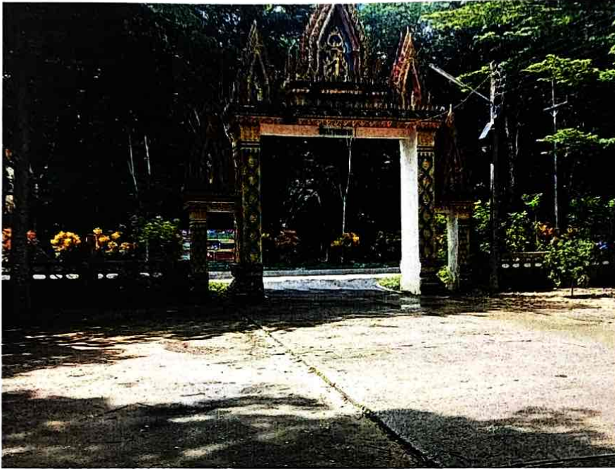
ลานกีฬา หมู่ที่ 1 บ้านทุ่งนา (ที่ตั้ง วัดนางย่อน)